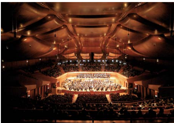
DIVERSIDADE RENZO PIANO JÁ FEZ QUASE TUDO: TORRES RENZO PIANO (SÃO FRANCISCO); AEROPORTO DE KANSAI (OSAKA, JAPÃO); SEDE DO JORNAL "THE NEW YORK TIMES" (EUA); "BUBBLE" (PORMENOR DO PROJETO "IL BIGO DI GENOVA", ITÁLIA); INSTITUTO DE ARTE DE CHICAGO (EUA); INTERIOR DO AUDITÓRIO PARCO DELLA MUSICA (ROMA); PORMENOR DA PRAÇA POTSDAM (BERLIM)